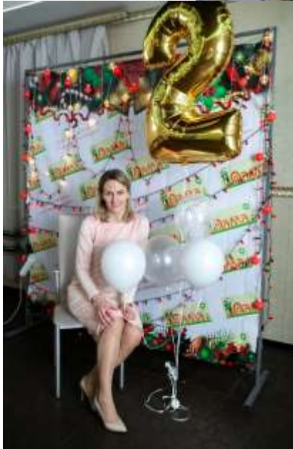
2020 год 11 января - ПРАЗДНИК НА 2 ГОДА СТУДИИ – «На здоровье!»